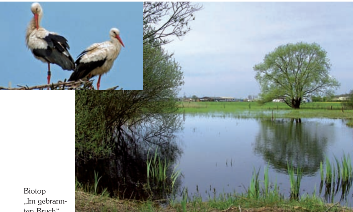
Biotop „Im gebrannten Bruch“

*Der genaue Termin dieser Veranstaltung wird rechtzeitig in der Ortspresse und auf unserer Homepage unter www.owk-eppertshausen.de bekanntgegeben.